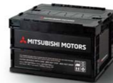
■折りたたみコンテナボックス50L SRG10047L ¥8,910 (消費税抜価格: 本体¥8,100)

日常のさまざまなシーンをサポートする、機能的でオシャレな三菱自動車オフィシャルグッズ。