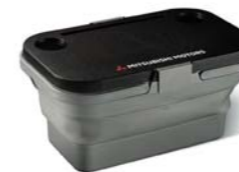
■折りたたみバケツ SRG10051 ¥3,630 (消費税抜価格: 本体¥3,300)