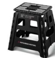
■折りたたみスツール SRG10048 ¥3,630 (消費税抜価格: 本体¥3,300)