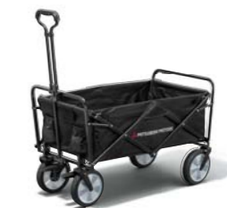
■折りたたみキャリーワゴン SRG10035 ¥16,500 (消費税抜価格: 本体¥15,000)